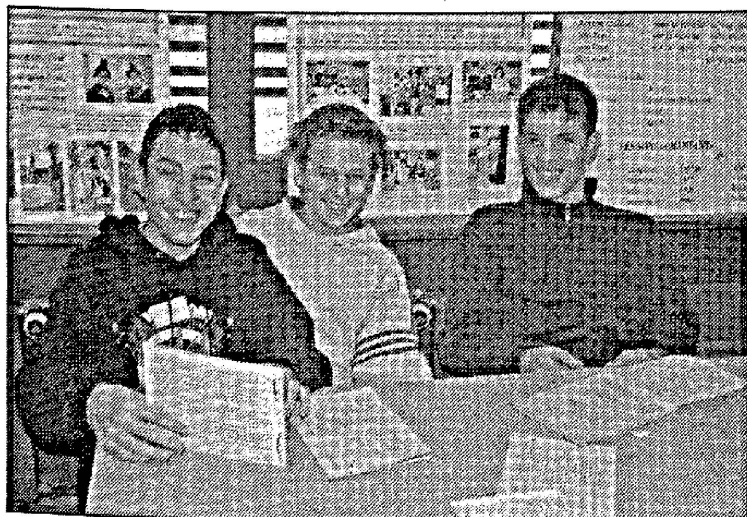
Atelier-patois, Savièse, 2005.

Des publications et des cours destinés aux adultes se mettent sur pied, avec le soutien de l'Université populaire à Fribourg et en Valais, des cours privés dans le canton de Vaud. Le concours Cerlogne en Vallée d'Aoste destiné aux élèves favorise l'approche du patois, la sensibilisation à l'égard de la langue. L'Ecole du patois s'est ouverte en Vallée d'Aoste. Il a fallu encore l'ardeur farouche des défenseurs du patois jurassien pour que l'école aménage une