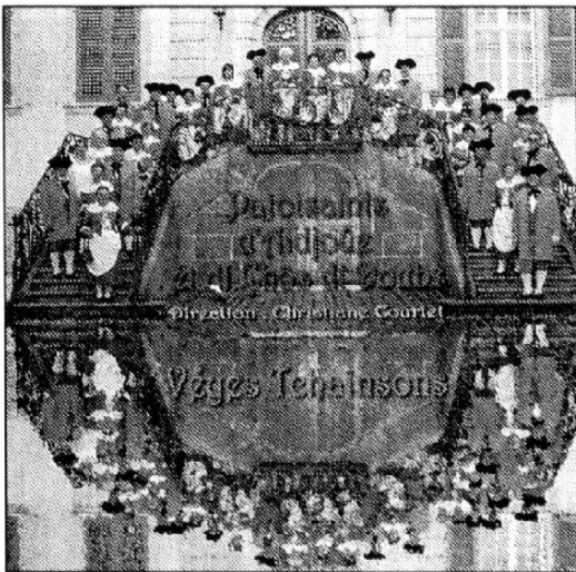
Pochette du CD

1926 aux Rouges-Terres] comble donc une lacune, et il est certain que le grand public se réjouira de disposer enfin d'un ouvrage de vulgarisation sur le lexique et la phraséologie du patois de cette région.