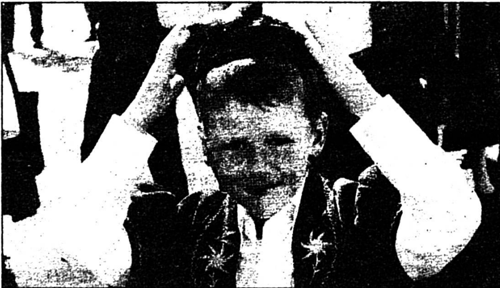
La relève des patoisants semble assurée.