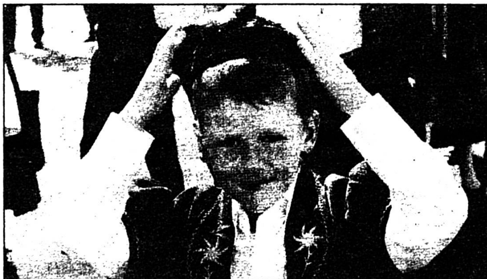
La relève des patoisants semble assurée.