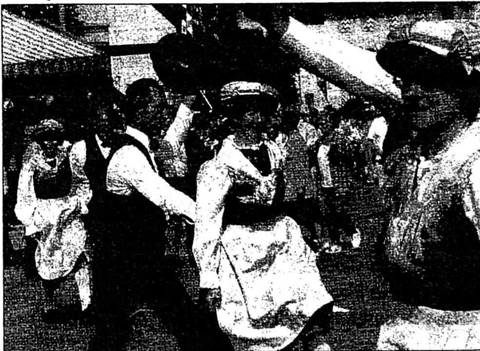
Le patois un lien très fort qui unit hommes et femmes au terroir.