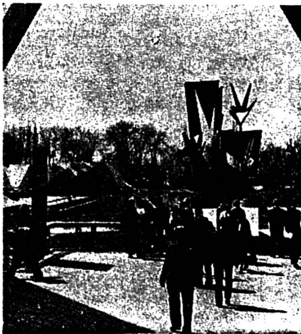
Dernière vision de l'« Expo 64 » : Le Serment des Trois Suisses! (FAL)

Ce comité comprendra des délégués des diverses associations linguistiques de la Suisse (les patois romands seront repré-