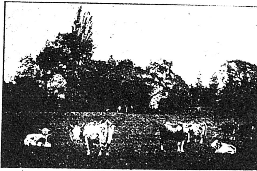
Vaches au pâturage.

En quelques minutes, le train de Berne nous emmène en pleine campagne. Il file, il file... c'est délicieux d'être ainsi transporté loin de la ville, à travers les prairies et les grands bois ! Une première halte à Palézieux nous permet de nous orienter. Comme on apprend bien sa géographie, dans le grand livre de la nature si richement illustré ! Voici le mont