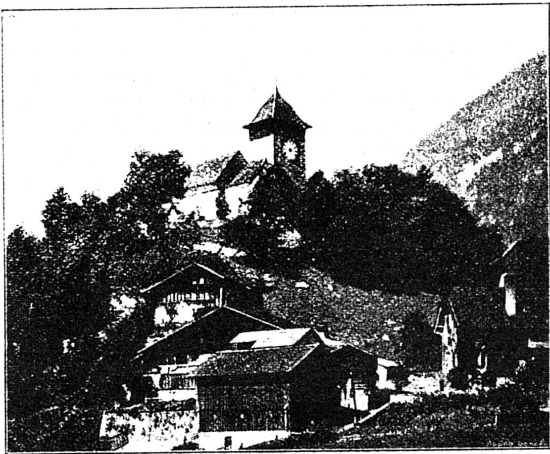
Eglise de Château-d'Ex.

peaux qui broutent le gazon parfumé. Montant, montant toujours, nous traversons Allières, petit hameau fribourgeois à peine habitué au sifflet de la locomotive, encore une dernière pente et nous sommes sous le col de Jaman. Bon, nous entrons dans un tunnel ! Plus rien que la nuit et le froid qui fait bien vite remonter toutes les glaces du wagon. Heureusement, ce n'est pas long. Quel bonheur de revoir la lumière, les arbres, le ciel bleu et... le lac, car c'est bien lui, notre Léman, qu'un coup de baguette magique semble avoir ramené au pied de ses montagnes, là-bas, au fond de la plaine. Nous rentrons donc chez nous ? Oui, bientôt, trop tôt ! Une courte halte encore, aux Avants, pendant que les étoiles s'allument, le temps de nous ressaisir et de graver dans nos cœurs émus et reconnaissants les impressions, les images qui vont disparaître ! Une halte aussi pour reprendre courage avant de redescendre dans la plaine et... dans la vie, où nous attendent les luttes et les devoirs de chaque jour !