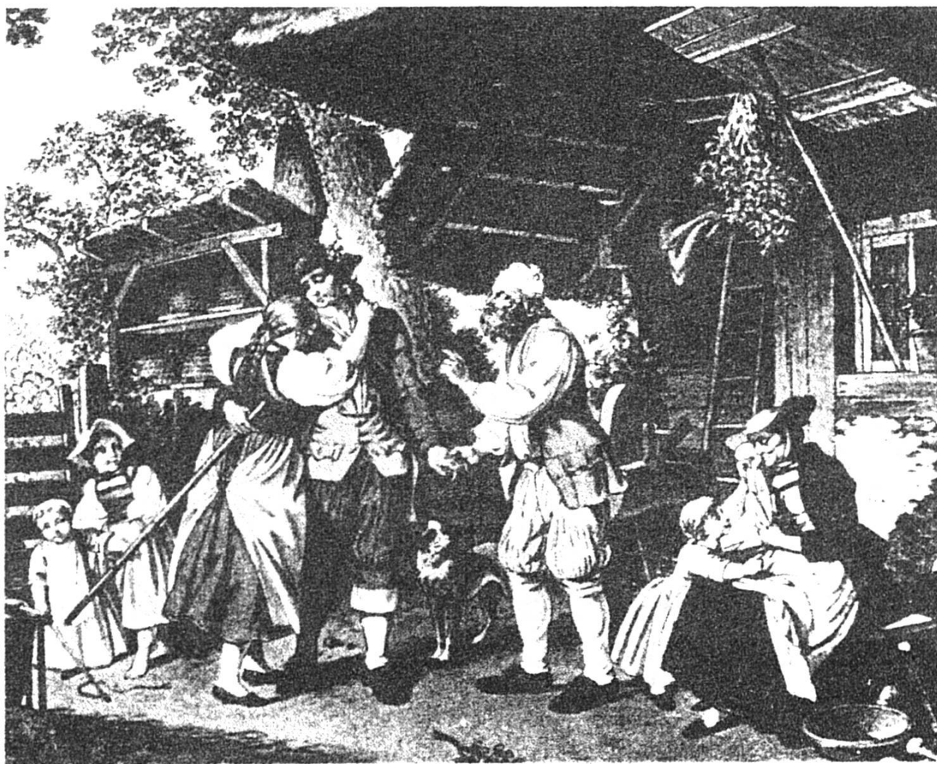
«Départ du soldat suisse», d'après une aquarelle de Sigmund Freudenberger (1745–1801). A gauche, sur l'image un rucher au temps de l'élevage des abeilles en paniers.