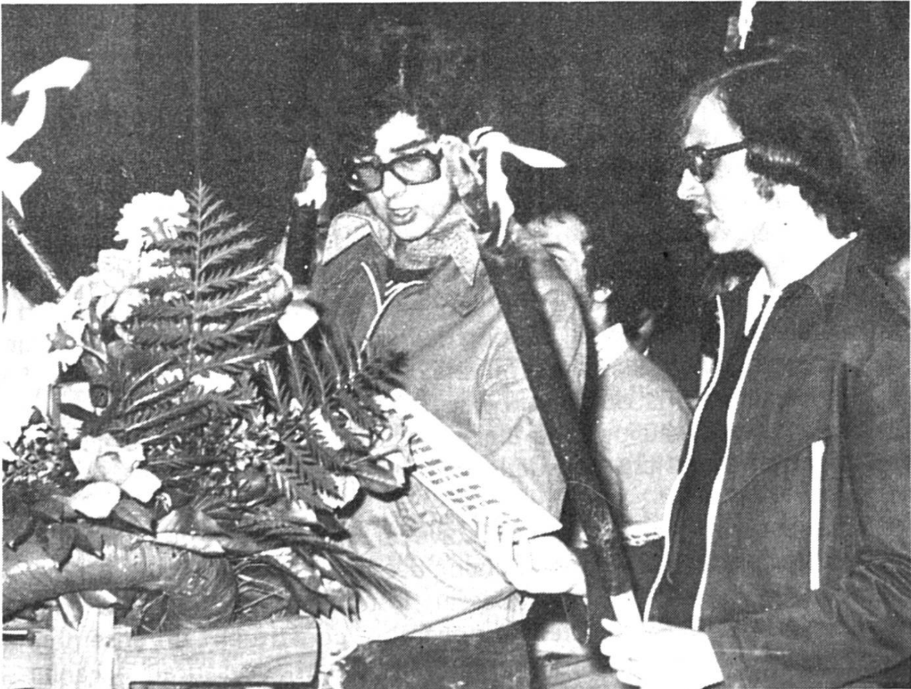
Le chant du Surrexit, durant la nuit de Pâques, sur le cimetière

Blottie durant de longs siècles autour de sa majestueuse collégiale, entourée d'un imposant système de défense composé de tours et de remparts, la petite cité des rives du lac de Neuchâtel s'est peu à peu éveillée à la vie moderne. L'industrie a largement devancé l'agriculture alors que le commerce et l'artisanat, menacés par la présence de grandes villes voisines, ont fourni un bel effort afin de conserver au chef-lieu broyard une situation aujourd'hui enviable. Il est vrai que la position géographique de la localité, sise au bord du lac, lui enlève passablement l'importance dont jouissent par exemple Romont ou Bulle.