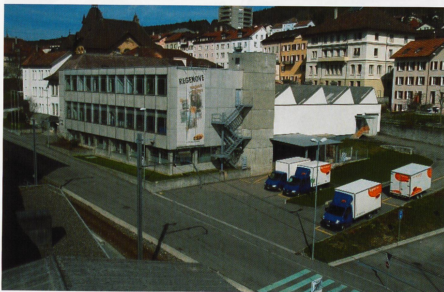
Regenove, l'entreprise de réinsertion professionnelle par l'emploi et la formation du CSP (Centre Social Protestant) Berne-Jura, est installée à Tramelan.

l'instar de n'importe quelle entreprise, Caritas Jura a un devoir d'équilibre de ses comptes. «Nous ne sommes pas une entreprise de déchetterie; c'est parfois délicat de l'expliquer aux personnes qui nous appellent.»