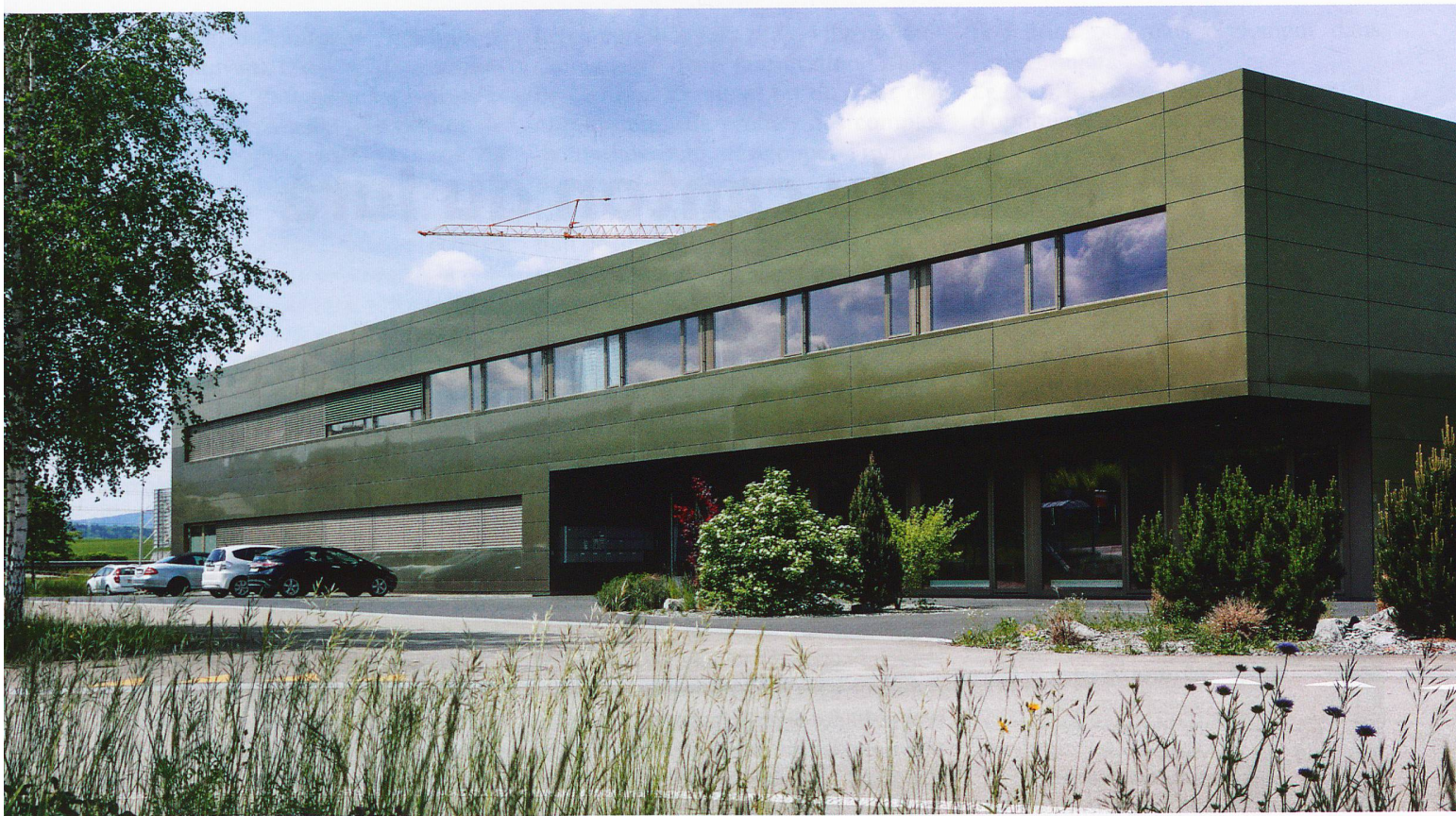
La zone Innodel, entre Courrendlin et Delémont, qui accueillera l'antenne jurassienne du Parc suisse de l'Innovation.

notamment en accueillant des projets de recherche et développement dans la future antenne jurassienne du parc. Des projets qui seront conduits à travers des coopérations réunissant des acteurs économiques, des universités, des hautes écoles spécialisées ou des instituts, à l'instar du Centre suisse d'électronique et de microtechnique.