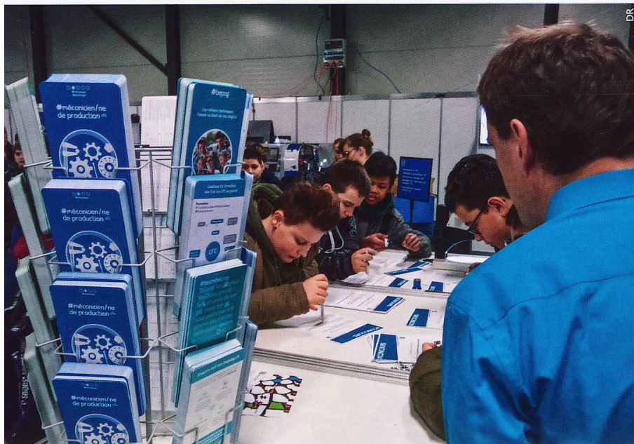
Au récent Salon interjurassien de la formation, à Moutier, l'intérêt est de mise.