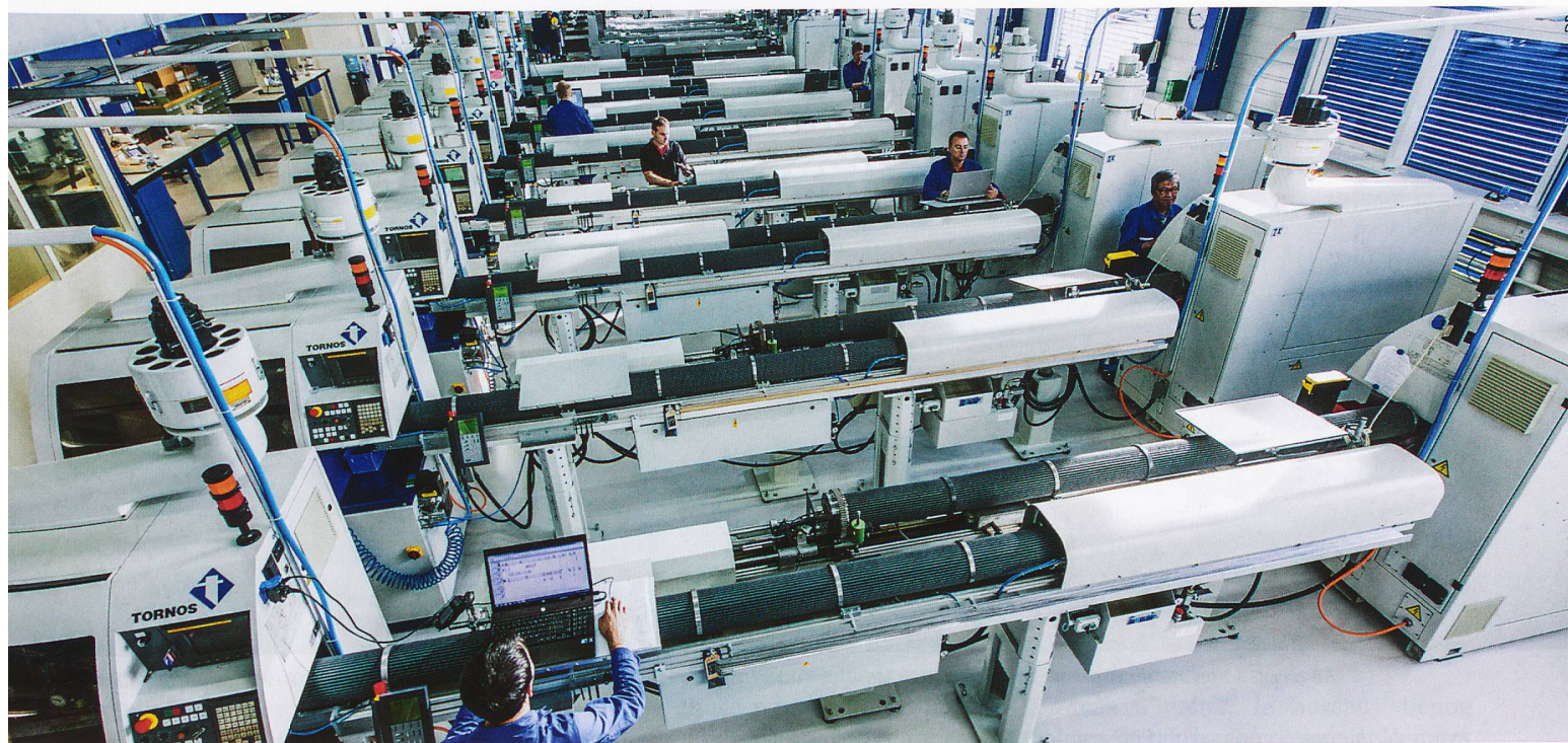
Un atelier de décolletage d'aujourd'hui.