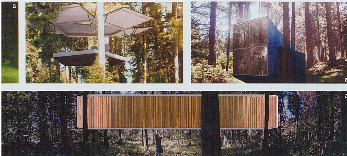
Quelques projets des différentes cabanes prévues à partir de 2017.