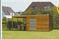
ABRIS ET COUVERTS