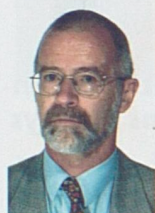
Par Jean-Philippe Chollet

Un des effets collatéraux - pour utiliser un terme à la mode - de la construction de la Transjurane est certainement sa contribution, peu connue mais majeure, à l'amélioration des connexions entre différents réseaux d'adduction d'eau dans le Canton du Jura.