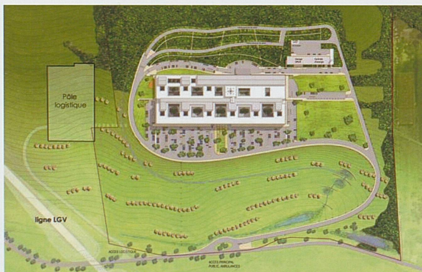
Le projet d'hôpital médian de Belfort-Montbéliard, à Trévenans

On le voit, le Ministre de la santé de la République et Canton du Jura a ouvert la porte à des collaborations transfrontalières dont le potentiel d'activité s'avère très intéressant.