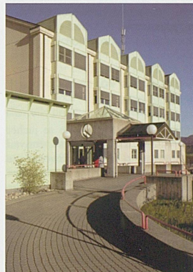
Le site de Delémont de l'Hôpital du Jura

Dans le domaine de la formation à la médecine d'urgence, le CHMB met à disposition son centre d'enseignement des soins d'urgence (CESU) pour la formation de formateur et la formation du personnel médical, infirmier et ambulancier.