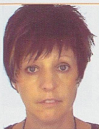
Par Patricia Vollmer

Cheffe de la Section des bourses et prêts d'études RCJU