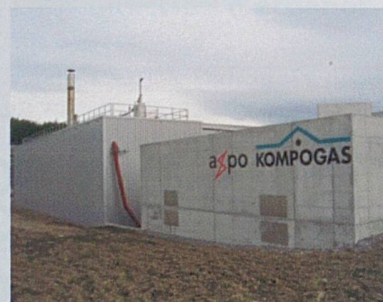
Modèle pour Lavigny: l'installation type Kompogas à Aarberg (BE)

L'entreprise Germanier Recyclage SA exploite depuis 1992 la compostière régionale de Lavigny. L'installation traite actuellement jusqu'à 8'000 tonnes de déchets verts pour une population d'environ 150'000 habitants. Afin de pouvoir traiter des fractions de déchets organiques qui conviennent mal au compostage, dans des conditions environnementales optimales, il a été décidé de compléter l'infrastructure existante par une installation de méthanisation. L'installation projetée traitera 12'500 tonnes provenant également de sous-produits organiques d'industries agro-alimentaires pour une production totale de 7'200 MWh de biogaz. Le procédé choisi baptisé «KOMPOGAS-Compact» permet d'intégrer facilement des unités modulaires de méthanisation sur des sites dotés de lignes de compostage. La mise en service de l'installation est prévue en 2008.