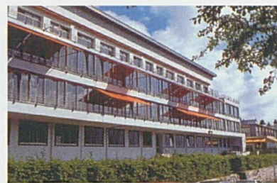
L'Hôpital de Saint-Imier

le site A et après quelques jours, pour suivre sa réadaptation sur le site B par exemple. Le déplacement facilité et très régulier de certains professionnels, administratifs, médicaux ou paramédicaux, d'un site à l'autre, permet également de mieux utiliser le potentiel des ressources à disposition.