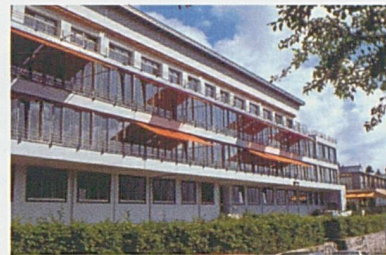
L'Hôpital de Saint-Imier

le site A et après quelques jours, poursuivre sa réadaptation sur le site B par exemple. Le déplacement facilité et très régulier de certains professionnels, administratifs, médicaux ou paramédicaux, d'un site à l'autre, permet également de mieux utiliser le potentiel des ressources à disposition.