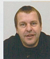
Par André Rothenbühler

Le concept est finalement simple. L'image de la Suisse à l'étranger se définit par quelques mots qui fondent aussi notre identité: neutralité, banques, chocolat, montagnes et montres. L'Arc jurassien, entre Genève et Bâle, produit la quasi-totalité des montres suisses. Au niveau touristique, le tourisme vert est notre point fort, mais toutes les régions du monde proposent ce type de tourisme. Il est dès lors très difficile de se distinguer parmi elles et donc d'attirer de nouveaux clients. En utilisant la marque «Watch Valley» et les montres pour se faire connaître, on dispose ainsi d'un atout unique, très porteur et très suisse. Ce concept a d'emblée connu le succès en remportant le deuxième prix du tourisme suisse en 2001.