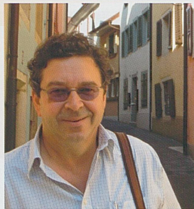
Par Jean-Paul Bovée

Après plusieurs mois de détérioration, les bénéfices des entreprises de nos régions se sont stabilisés.