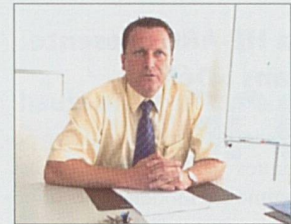
Par Maxime Zuber

Regroupés dans le cadre de la Haute Ecole spécialisée de Suisse occidentale (HES-SO), dont le siège est établi à Delémont, les cantons romands ont admis, dans leur cercle, le canton de Berne qui souhaitait, par son adhésion partielle, répondre aux besoins de sa région francophone et donner toutes les chances de développement aux formations tertiaires de langue française.