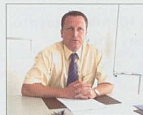
Par Maxime Zuber

Regroupés dans le cadre de la Haute Ecole spécialisée de Suisse occidentale (HES-SO), dont le siège est établi à Delémont, les cantons romands ont admis, dans leur cercle, le canton de Berne qui souhaitait, par son adhésion partielle, répondre aux besoins de sa région francophone et donner toutes les chances de développement aux formations tertiaires de langue française.