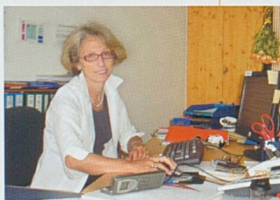
Par Diane Reinhard

Cette chronologie «théorie-application» a été systématiquement respectée dans les études postgrades en management organisation et communication. Le programme est conçu de manière à maîtri-