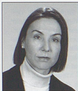
Par Evelyne Clerc

Docteur en droit, LL.M., titulaire du brevet d'avocat. Chargée de cours à la Faculté de droit de l'Université de Neuchâtel