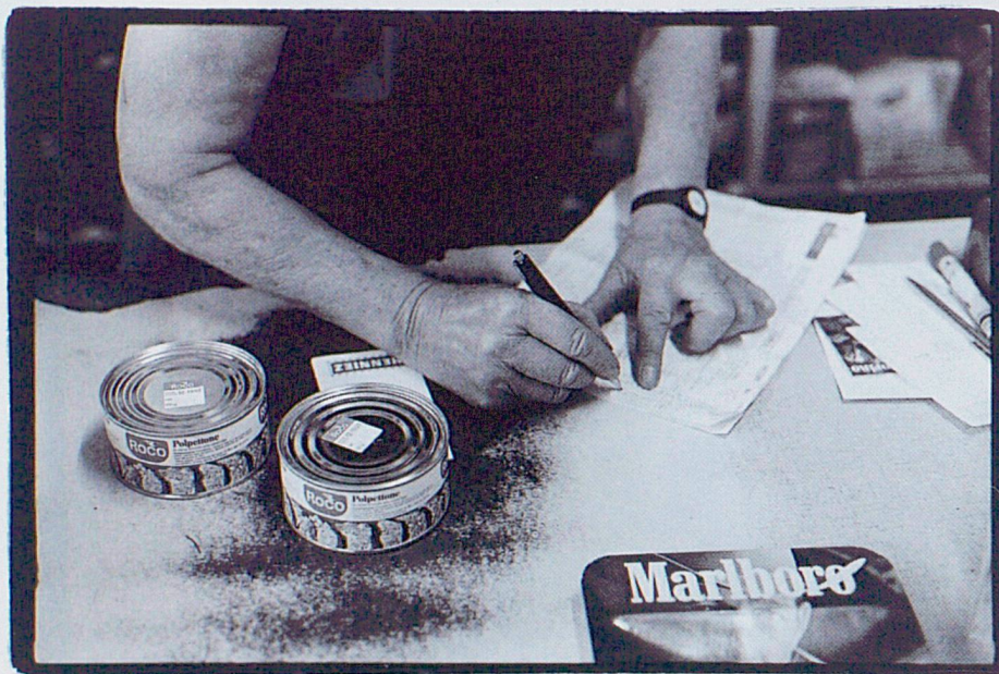
Mémoires d'Ici, fondation régionale ouverte au public, recueille et met en valeur non seulement les témoins du passé, mais aussi ceux qui reflètent l'actualité d'aujourd'hui, qui sera le passé de demain.

Jura bernois. Le CEJARE, Centre jurassien d'archives et de recherches économiques, a récemment été créé pour sauvegarder et mettre en valeur ce patrimoine, au-delà des aléas de la conjoncture économique. Proche par sa vocation et par son travail de l'activité de Mémoires d'Ici, le CEJARE est installé sous le même toit que Mémoires d'Ici qui se réjouit de développer l'un des partenariats indispensables à l'approfondissement de la