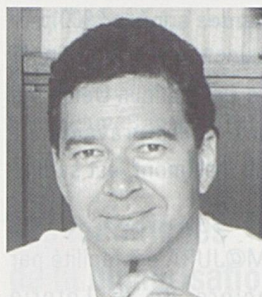
par Jean-Paul Bovée, secrétaire général de l'ADIJ

La journée du 25 octobre 2001 a permis de se pencher sur les multiples questions soulevées par des domaines aussi complexes que les transports, l'environnement, l'aménagement du territoire et les communications.