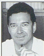
Par Jean-Paul Bovée, secrétaire général de l'ADIJ