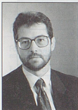
par François Matile, Secrétaire général de la Convention patronale de l'industrie horlogère suisse, La Chaux-de-Fonds.