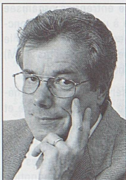
par Alain Sermet, directeur de l'agence Télécom PTT, Genève.