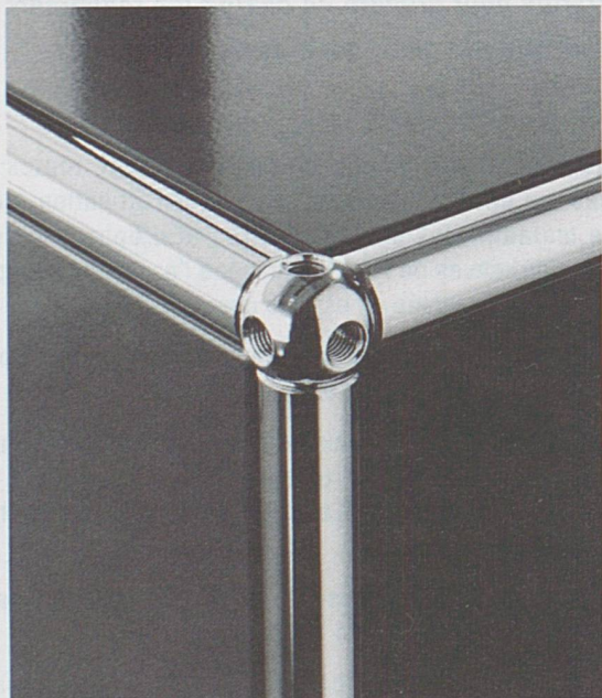
L'espace vu par USM