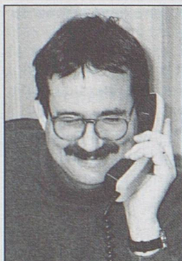
par Markus Siegenthaler, Délégué à la protection des données du canton de Berne