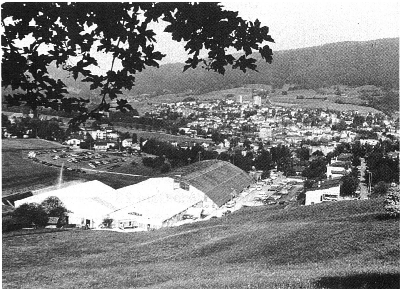
Le site du SIAMS en 1992, dans le prolongement de la patinoire couverte prévôtoise avec, en arrière-plan, la ville de Moutier.

Le SIAMS, vitrine du monde industriel moderne, ne faillira pas à sa mission ; plus encore que par le passé il sera au service des entreprises. Elles seules sont capables d'assurer la prospérité de cet Arc jurassien transfrontalier des microtechniques, de l'industrie de précision, de la machine-outils et du décolletage dont notre région est le centre.