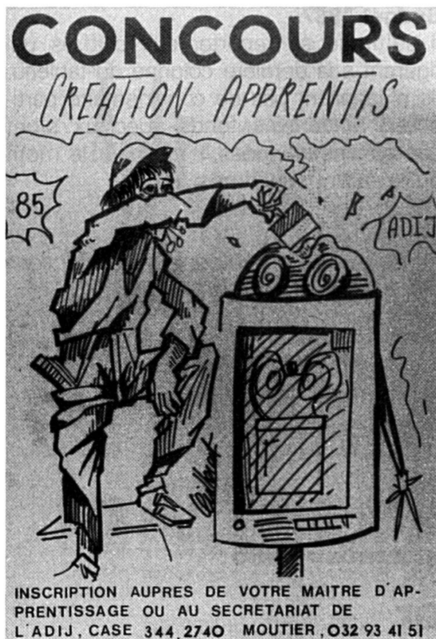
Une invitation à concourir.

un extraordinaire raccourcissement de la durée qui sépare la découverte technique de sa commercialisation. Ce phénomène n'est pas sans influence sur les métiers que nous exerçons.