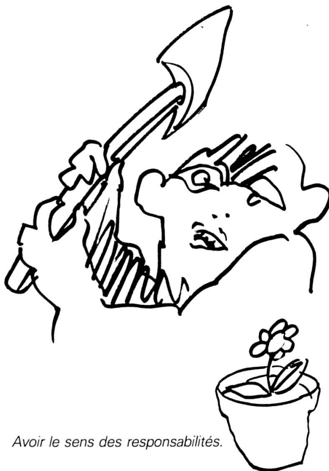
Avoir le sens des responsabilités.

Exercer des activités d'animateur ou de moniteur demande un certain nombre de qualités. Les premières, essentielles, sont le bénévolat et la générosité. Les sociétés reconnaissent le besoin de disposer d'animateurs formés et compétents, qui seuls peuvent assurer le bon