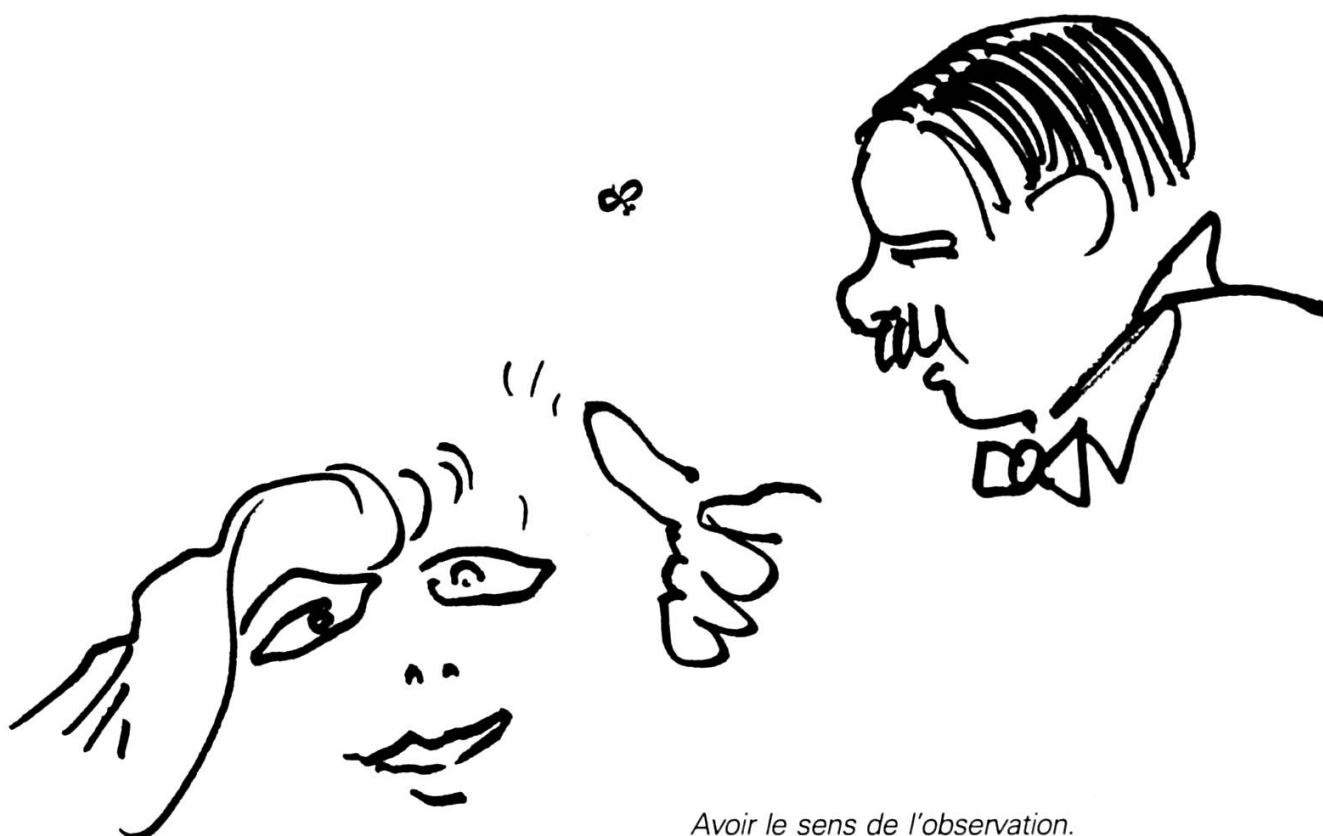
Avoir le sens de l'observation.

bilité, pour les jeunes, de sortir de la dépendance. Constatons au surplus que cette période d'abstention est plus ou moins courte: certains ont besoin des institutions, d'autres non. Toutefois, on voit mal les adultes ou leurs institutions résoudre à eux seuls ce problème du manque passager de participation.