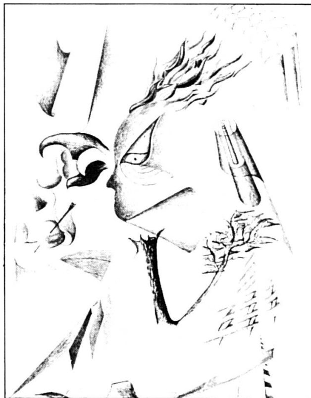
Une œuvre primée dans la catégorie «travaux libres».