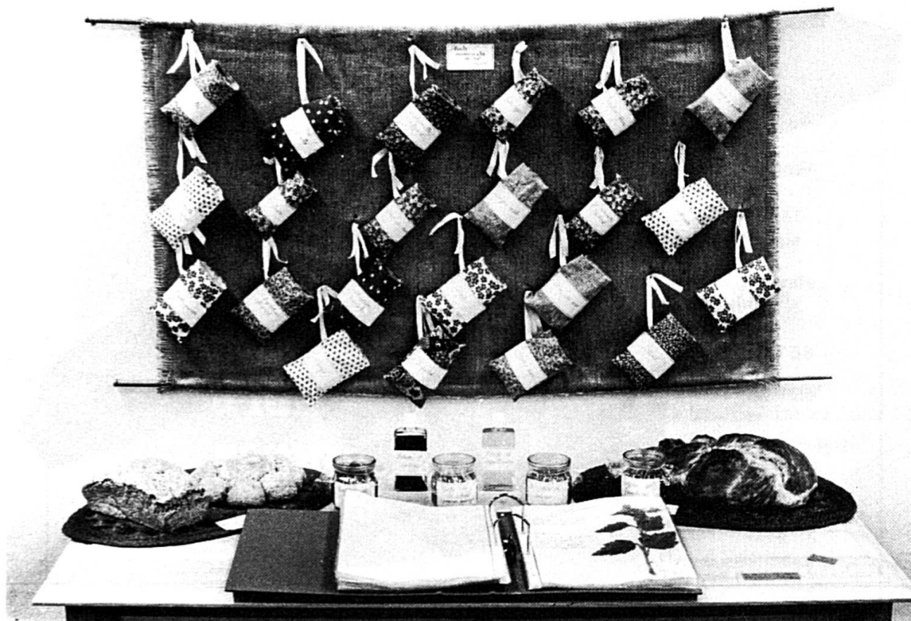
Une collection d'herbes médicinales.