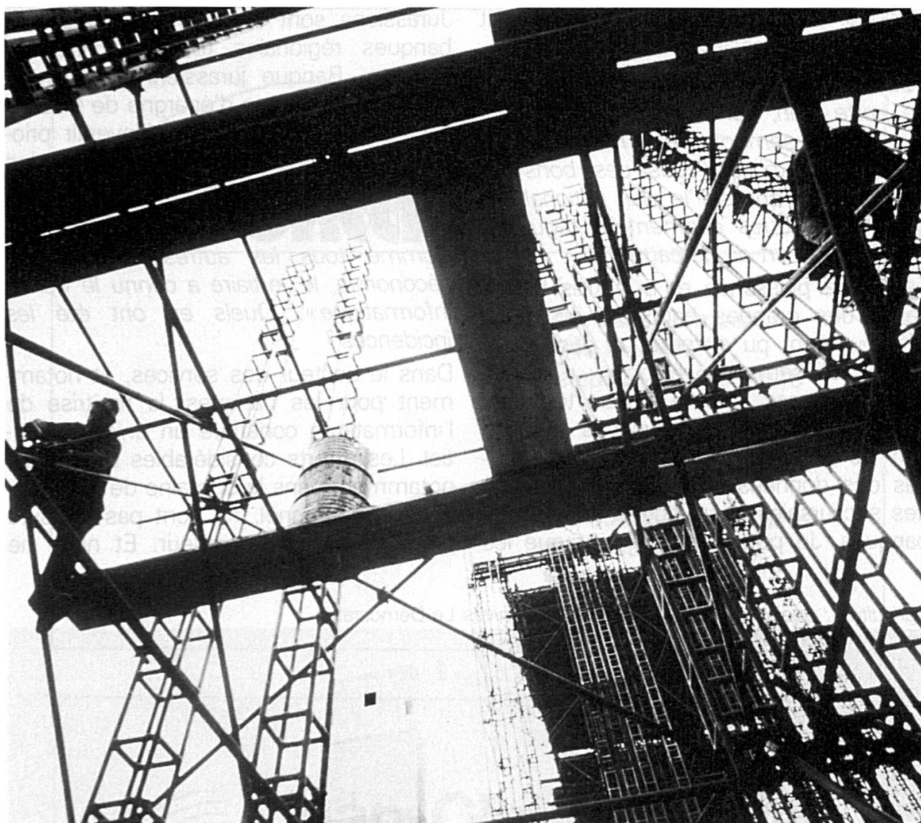
Bâtiment et génie civil: une année faste.