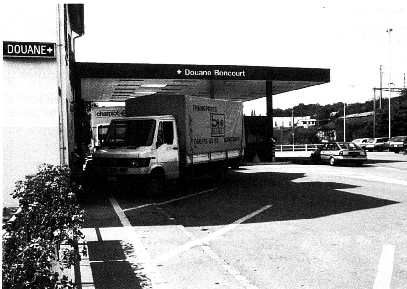
Avec GEFCO, BOTEC et CHARPIOT constituent les gros « clients » du poste douanier de Boncourt.

en direction d'Oensingen. Les 3,90 mètres actuels posent des problèmes aux camions construits pour les gabarits internationaux de ... quatre mètres. Un détail, penserez-vous, mais des « ver-rues » comme celles-ci nuisent au bon développement des transports routiers internationaux.