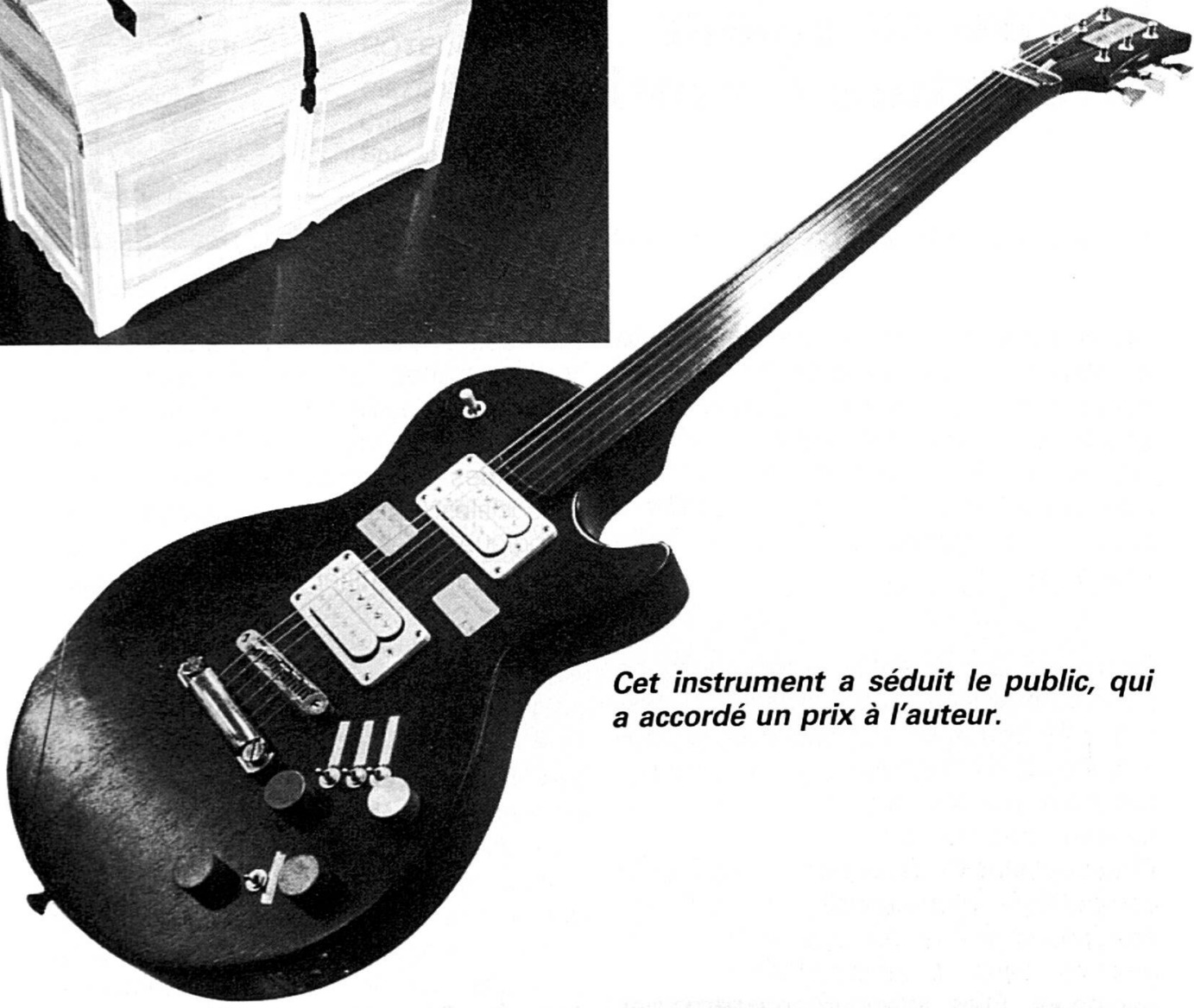
Cet instrument a séduit le public, qui a accordé un prix à l'auteur.