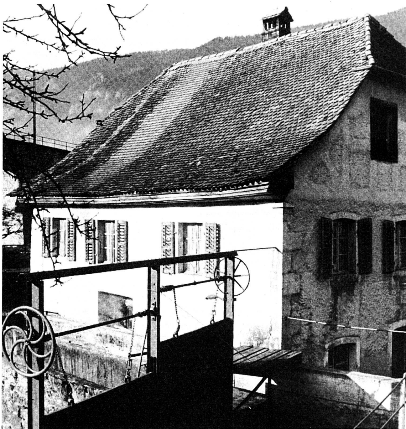
Ancienne forge de Corcelles.