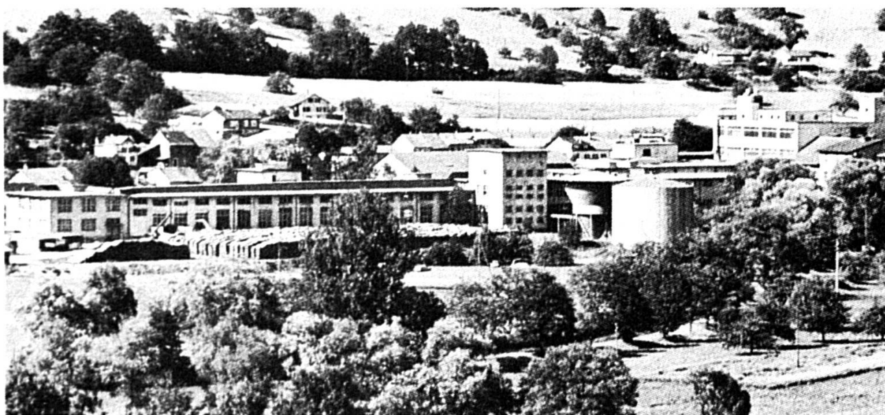
Fabrique de papier, Zwingen.