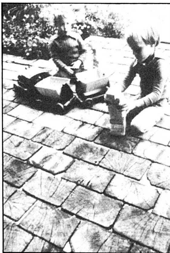
Pour rajouter une pièce de plein air à son appartement, il est judicieux de bien choisir la nature du revêtement de sol. Les pavés de bois offrent une solution originale, qu'ils soient ronds ou rectangulaires.

Les villas luxueuses, isolées dans la campagne et entourées d'immenses parcs appartiennent à l'architecture du passé. Le renchérissement des terrains, dû à la disparition progressive des surfaces constructibles, a considérablement diminué la dimension des propriétés. Malgré cela, il reste encore suffi-