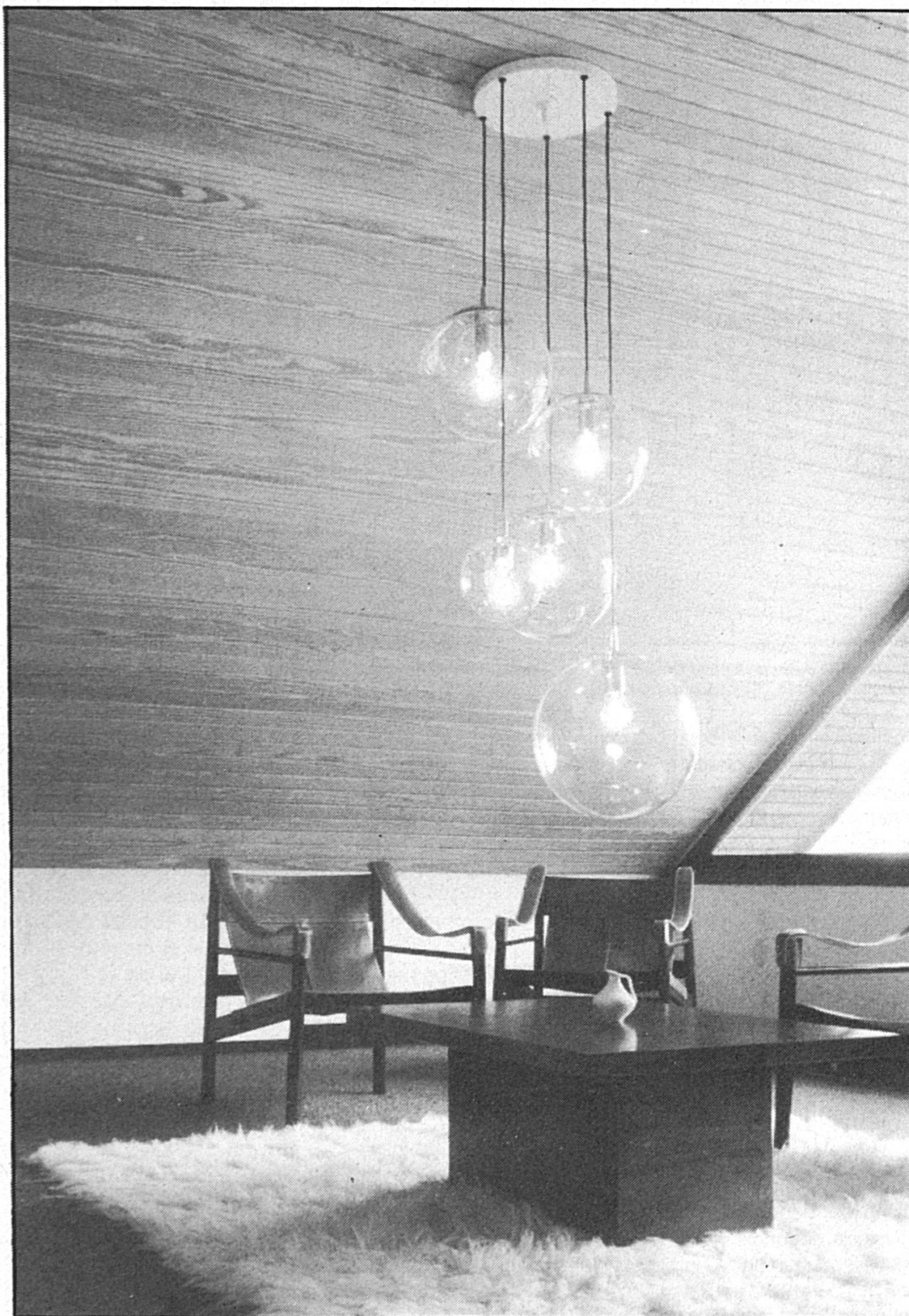
Les pièces un peu froides destinées au séjour de personnes peuvent être «réchauffées» par l'emploi du bois.