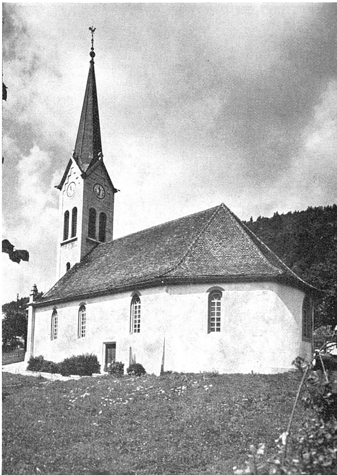
La haute flèche de l'église : Il n'y a pas que les sapins pour élever l'homme...