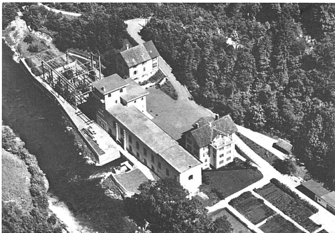
USINE DE LA GOULE SUR LE DOUBS