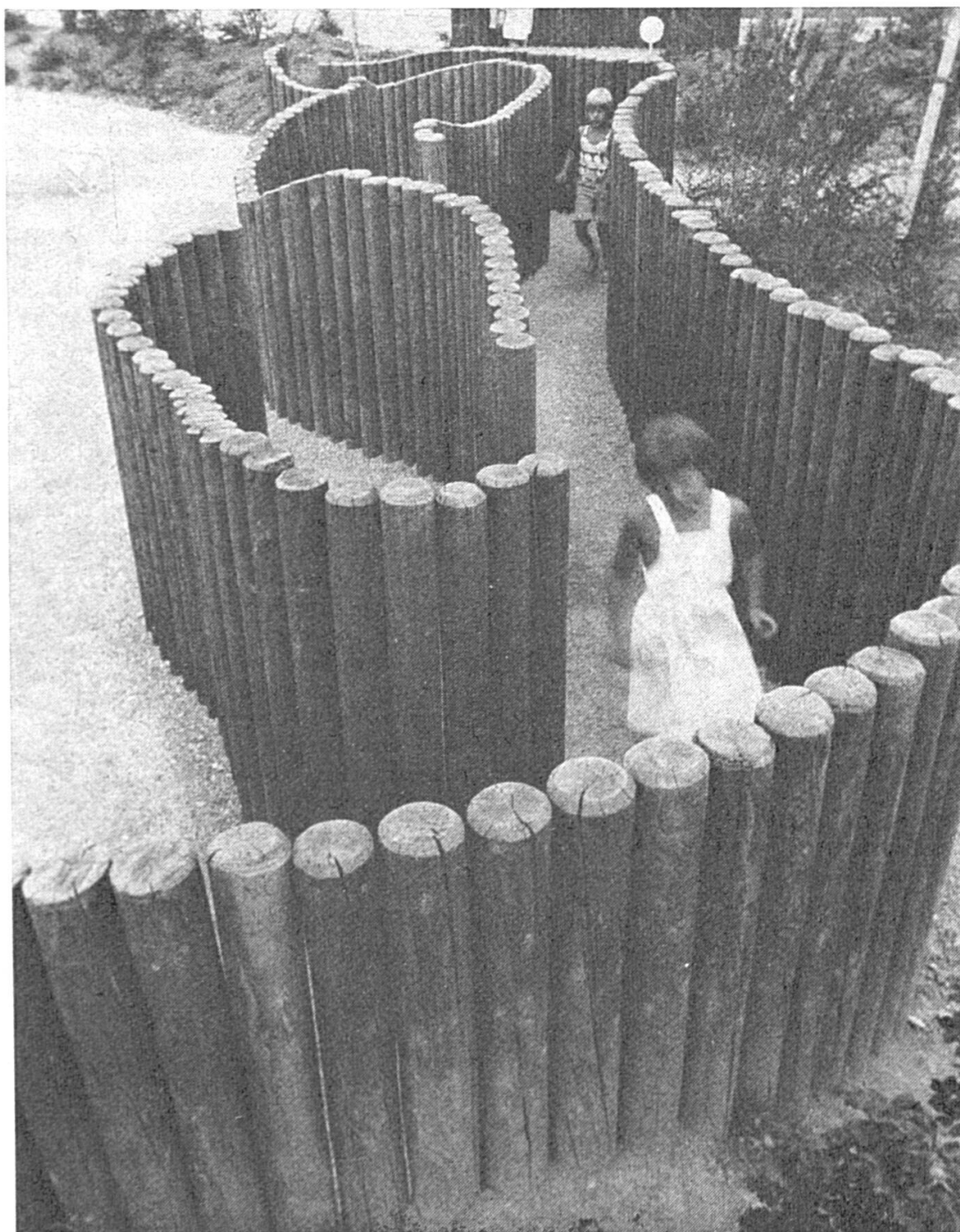
L'attrait d'une place de jeux dépend essentiellement d'une disposition variée et vivante. Le bois, matériau naturel, crée une ambiance sécurisante pour les enfants.

périmentations. Les installations en bois sont les meilleures du point de vue valeur pédagogique car elles correspon-