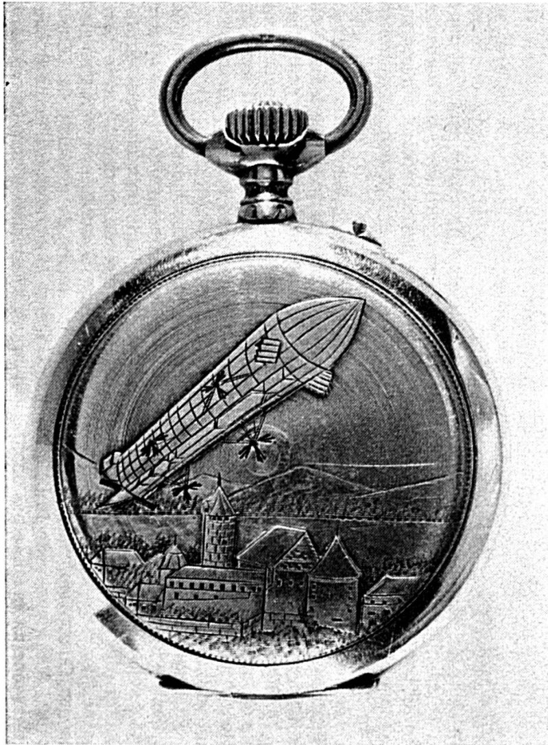
Montre avec fond de boîte gravé : le Château de Porrentruy et le « Zep- pelin », 1912.