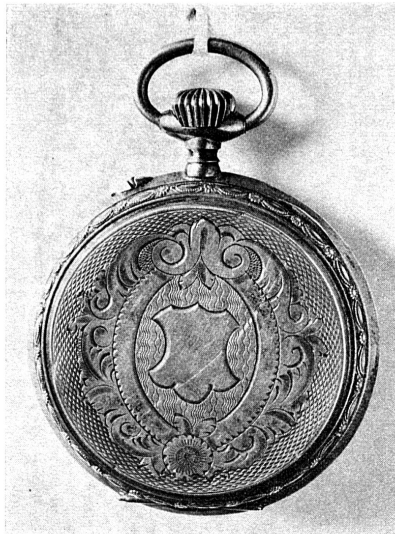
Montre avec fond de boîte guilloché et grand écusson.