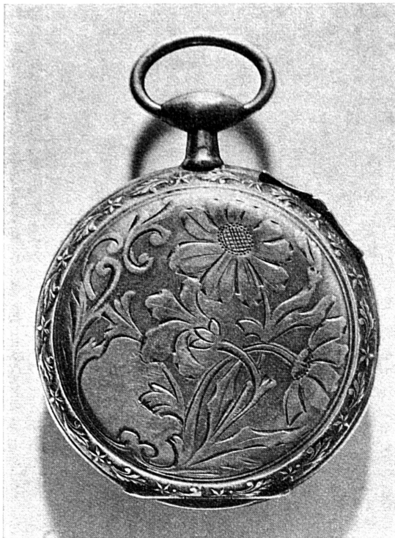
Montre avec fond de boîte gravé : fleurs et feuilles stylisées.