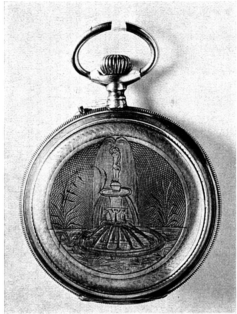
Montre avec fond de boîte guilloché et sujet gravé : femme et fontaine.