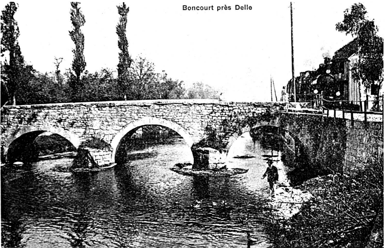
Passage d'un train du Jura-Simplon à Boncourt, vers 1900.