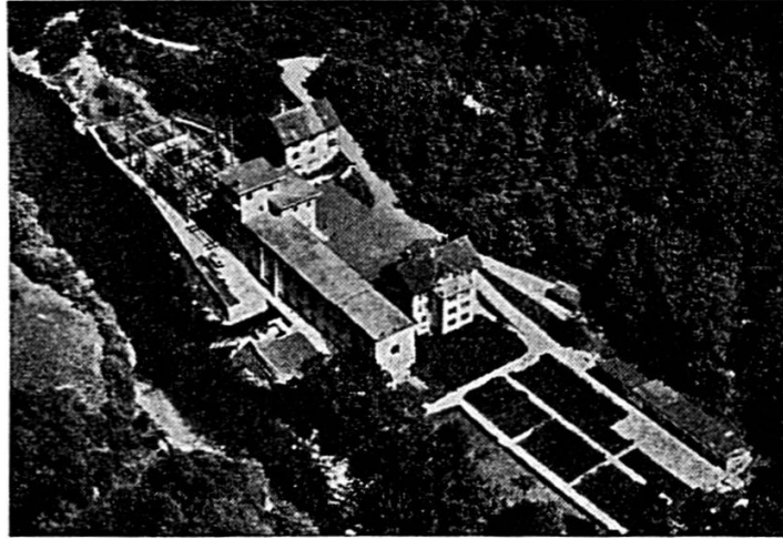
USINE DE LA GOULE SUR LE DOUBS