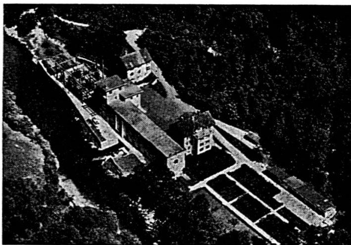
USINE DE LA GOULE SUR LE DOUBS