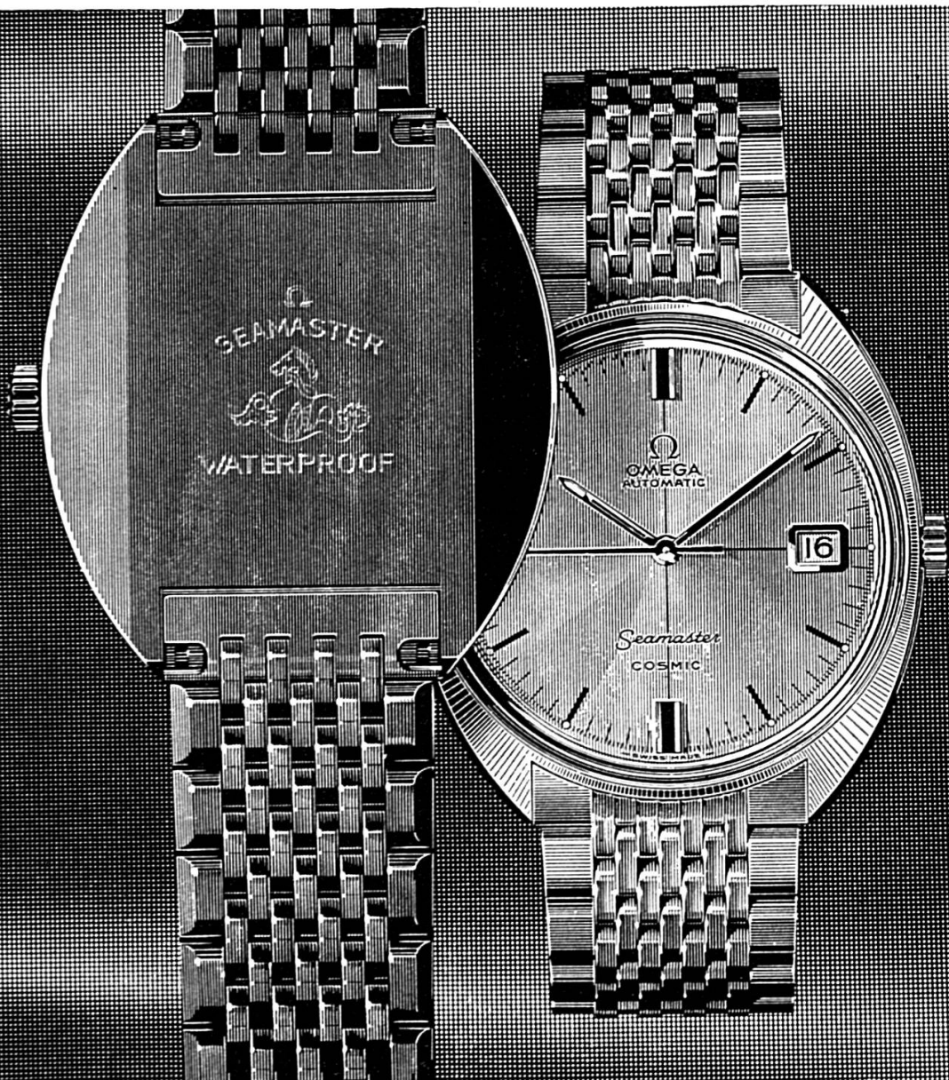
La Seamaster Cosmic: Etanche, calendrier, remontage automatique ou manuel