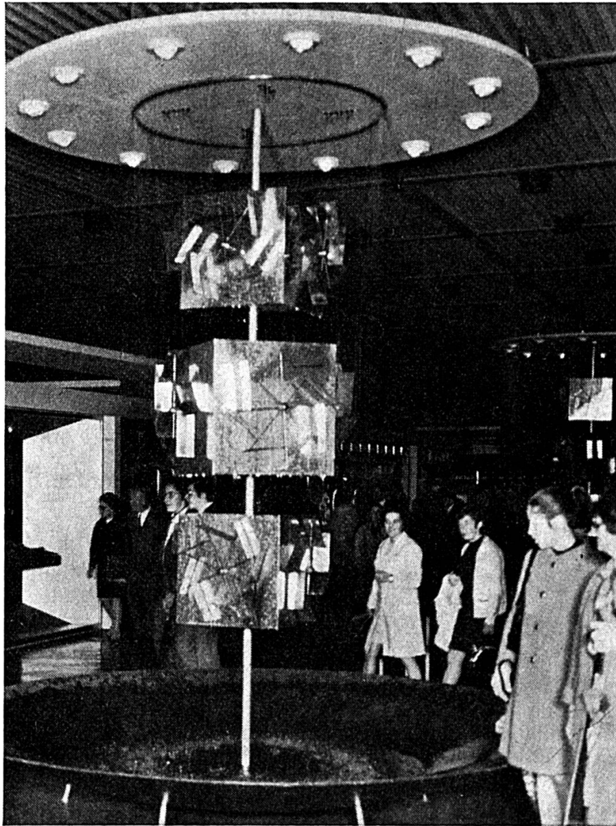
Pavillon de l'horlogerie

mence déjà à la halle 22 avec les appareils d'éclairage et le matériel d'installation électrique, mais il ne concerne cependant pas les produits de la halle 23, occupée d'après le système de rotation par les exposants du groupe électrotechnique : production et distribution de courant, appa-