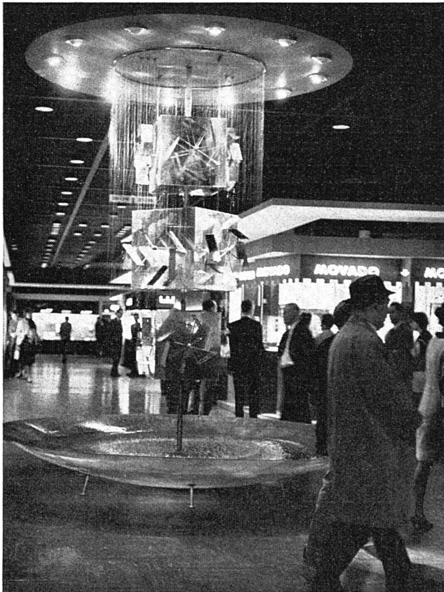
Le pavillon de l'horlogerie

Certains objets d'exposition sont en eux-mêmes des motifs de décoration, tels la porcelaine, la céramique, les travaux d'art appliqué ; on pourrait presque en dire autant de la dégustation dans les halles voisines : le vin, lui aussi, a sa fleur et son bouquet.