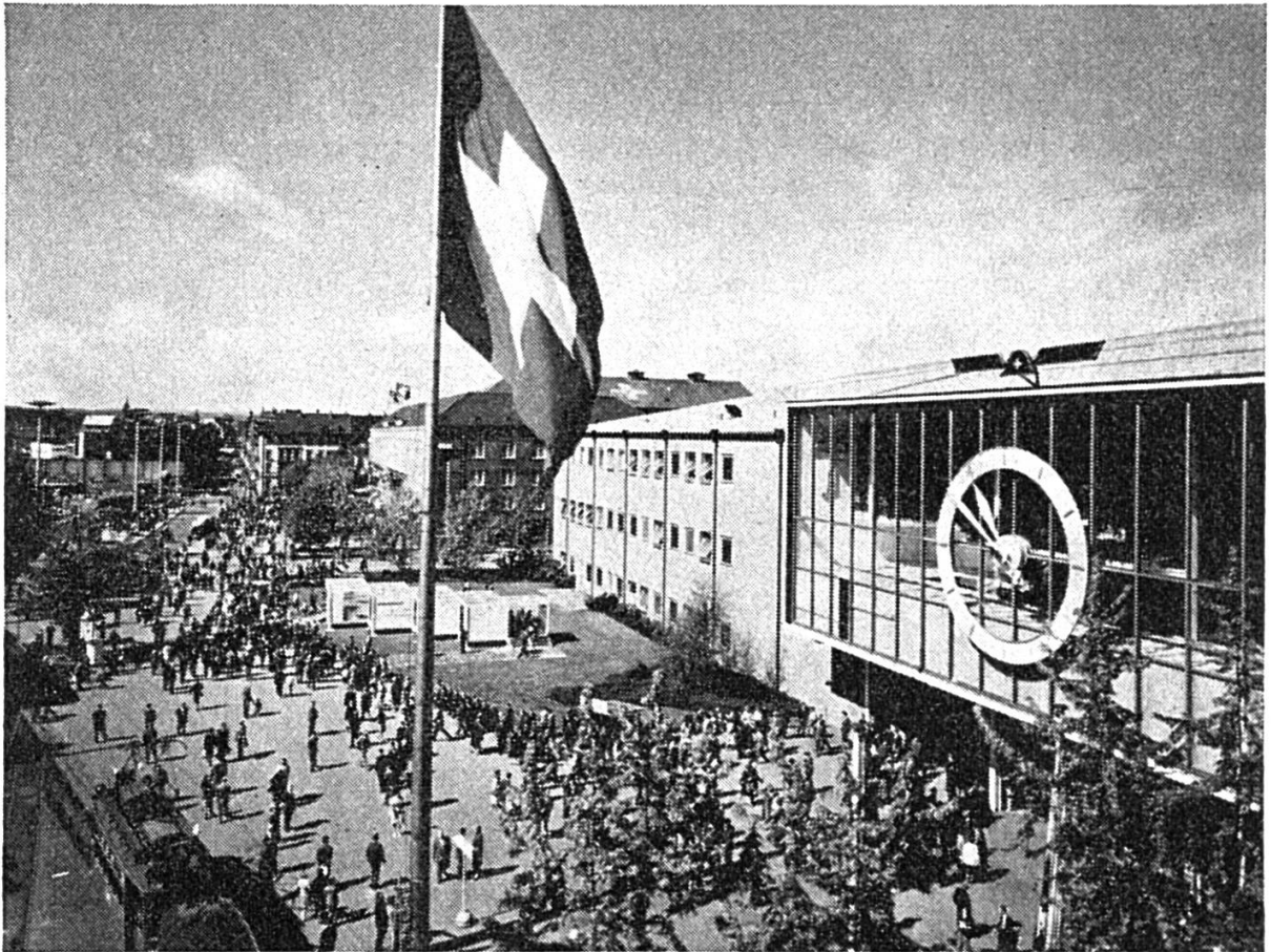
Place de la Foire

L'offre concentrée du groupe du bureau est maintenant transférée dans la halle 8 de si belle apparence ; cette même halle abritera deux présentations spéciales intéressantes : l'une sera consacrée au concours « La science appelle les jeunes » et l'autre montrera « Des métiers de l'artisanat graphique au travail ». C'est ici que s'imprimera chaque jour, entre autres, un journal de la Foire, réalisé sous les yeux des visiteurs. Le groupe du bureau est parcouru avec le plus grand profit par des